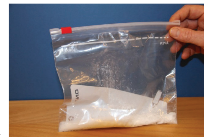
Eksperiment med resultatet av den opprinnelige VGG-reaksjonen på bildet øverst og resultat av tilsvarende forsøk, der variabelen fenolrødtløsning er endret til vann på bildet nederst.