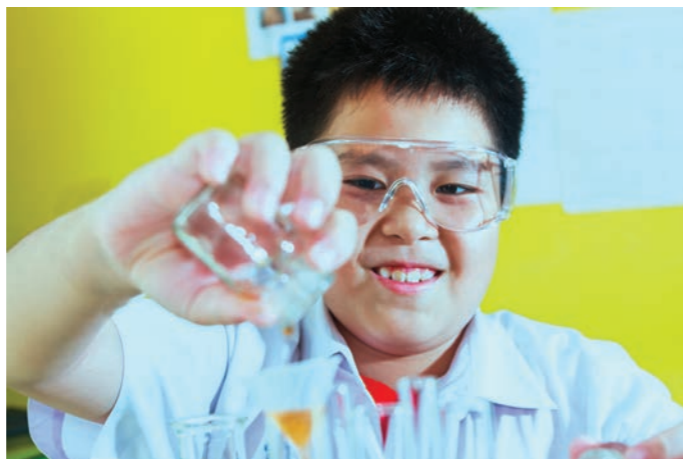
Når vi vet hva som skjer i en reaksjon, kan vi formulere sammenlignende spørsmål. Foto: colourbox.no

I løpet av undervisningsopplegget lærte elevene om flere spørsmålstyper og når det kan være lurt å bruke de ulike typene, se tabellen under. Elevene lærte for eksempel at hvorfor -spørsmål kan være gode spørsmål, men de er ofte for omfattende eller for vanskelige å finne svar på gjennom forsøk og eksperimenter i naturfagtimene. Hva skjer hvis -spørsmål kan være gode spørsmål i starten av en utforskning. Videre lærte elevene at når vi vet hva som skjer i en reaksjon, kan vi formulere sammenlignende spørsmål. Sammenlignende spørsmål kan handle om mål, f.eks. tid, temperatur eller mengder. For å svare på slike spørsmål må du gjøre et eksperiment der du sammenligner to eller flere reaksjoner.